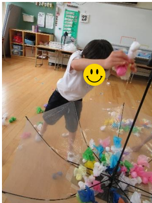
4年生「てるてるぼうずで遊ぼう！」

ナスとミニトマトを育てました。毎日水やりを頑張り、とても大きなナスと、赤い色がきれいなミニトマトを収穫することができました。