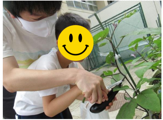
2年生「野菜の収穫をしよう」

運動会に向けての応援旗づくりを頑張りました。赤一色を1年生全員で、順番に「ペタペタペタ！」。絵の具の感触も冷たくてとても気持ちよかったです。