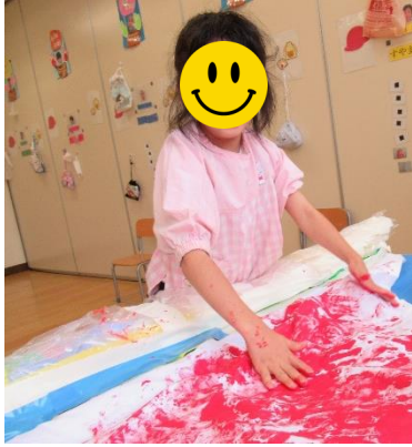
1年生「ペタペタしたよ！」

運動会に向けての応援旗づくりを頑張りました。赤一色を1年生全員で、順番に「ペタペタペタ！」。絵の具の感触も冷たくてとても気持ちよかったです。