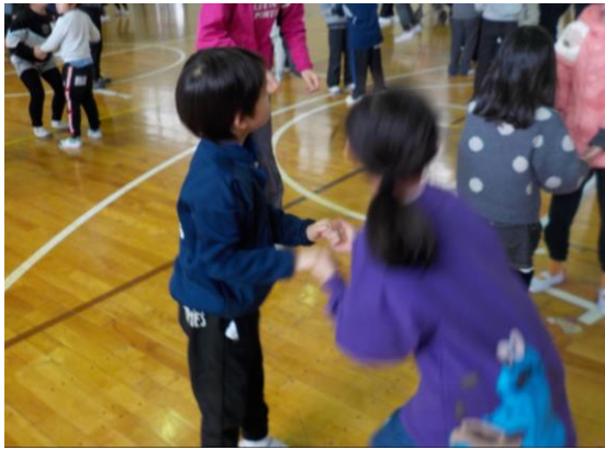
「第二回たかみな交流会」

宝小学校の友達と一緒にゲームやダンスをして遊びました。一年間の交流を経て、とても仲良くなることができました。